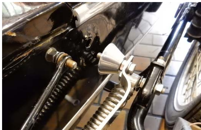
2 – Montage hinten