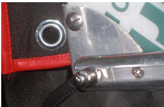
5 – ... gegen „Pilzschraube“