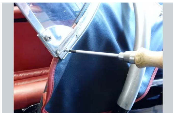
4 – Austausch vordere Befestigung ...