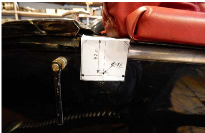
1 – Löcher für hinteren Befestigungspunkt bohren