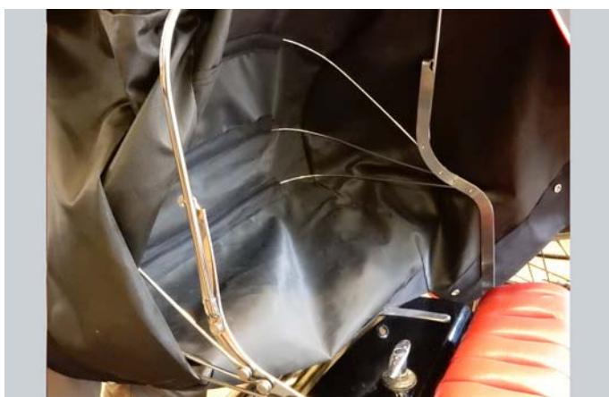
3 – Verdeck auffalten