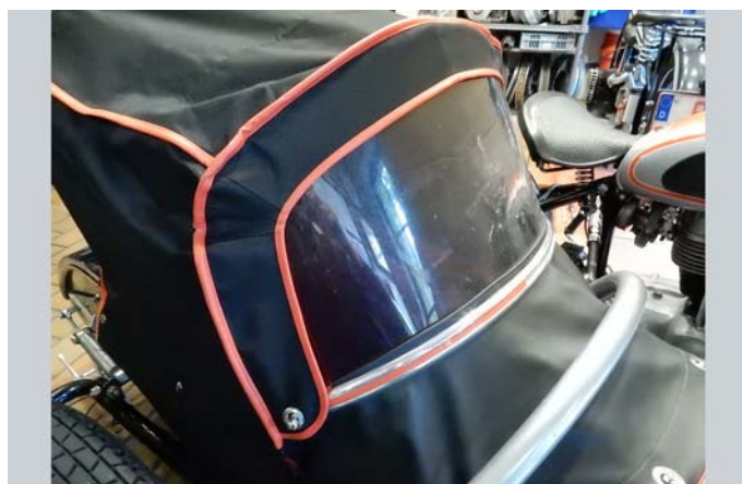
6 – Verdeck vorn einhängen