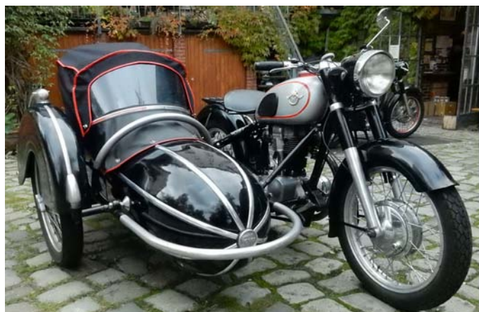
8 – Gespann mit fertig montiertem Allwetterverdeck